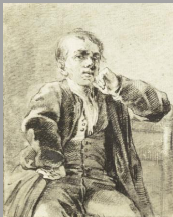
Zelfportret

Jacob Houbraken was een Noord-Nederlands tekenaar, graveur en kunstverzamelaar. Hij leerde het beroep van etser van zijn vader, Arnold Houbraken (1660-1719). In 1707 verhuisde hij naar Amsterdam, waar hij jarenlang zijn vader hielp met diens magnum opus ; het historische werk De Grootte Schouburgh der Nederlantsche konstschilders en schilderessen (1718-1721). Houbraken jr. legde zich vrijwel geheel toe op het maken van portretten. Zijn werk werd beïnvloed door de werken van Cornelis Cort, Jonas Suyderhoef, Gerard Edelinck en John Visscher. In samenwerking met de historicus Thomas Birch en kunstenaar George Vertue werkte hij aan een project getiteld Heads of Illustrious Persons of Great Britain , welke tussen 1743 en 1752 in etappes werd gepubliceerd in Londen. Hierboven een zelfportret uit 1770. Het Edams museum heeft 9 gravures van hem in de collectie.