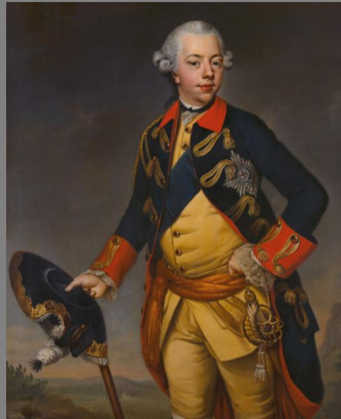
J.G. Ziesenis (Mauritshuis)

De Franse Revolutie maakte een einde aan het Ancien Régime en in Nederland verdreven de patriotten, tijdens de Bataafse Revolutie, stadhouder Willem V.